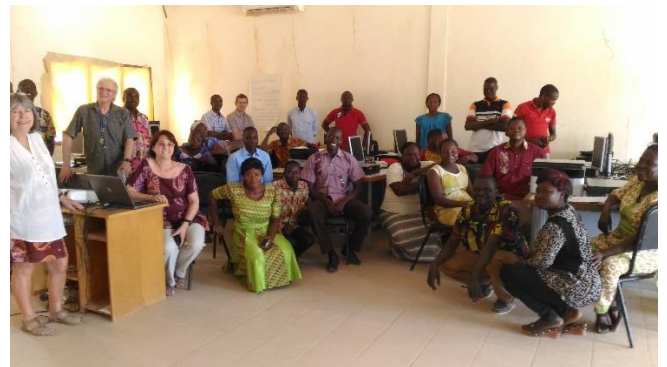
Chaque école concernée a été dotée de 2 ou 3 ordinateurs, d'une imprimante, d'une clé USB et d'une clé 4G Wifi. .

Dans une mission longue de 5 semaines , nous avons formé des enseignants aux logiciels informatiques (traitement de texte et tableur) afin de faciliter leur travail au quotidien. En effet dans des classes de 50 à 80 enfants, calculer les moyennes, les classements, faire des statistiques représentent un travail de titan. Cette mission composée de 5 bénévoles du 17 janvier au 21 février 2018 a pu former 24 enseignants de 8 écoles de la zone.