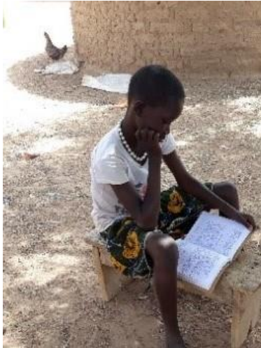
La soif d'apprendre

D'abord par du parrainage . Il est vrai que seulement 5 enfants sont parrainés, mais pour ces 5 enfants là, c'est l'assurance d'aller à l'école.