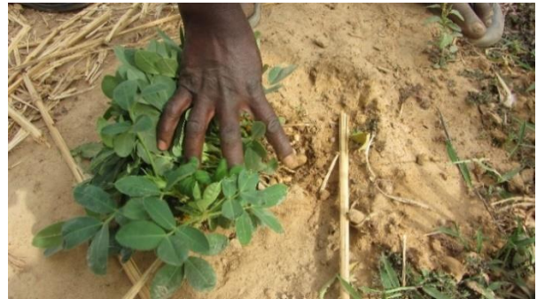
L'ne culture d'arachide

Les femmes africaines sont généralement celles qui tiennent les responsabilités familiales, cependant pour gérer leur famille elles ont un budget très restreint voire inexistant . Pourtant l'ambition d'entreprendre existe mais le capital de départ manque quasiment toujours à l'appel. Le micro-crédit leur donne l'occasion de se lancer avec courage et ténacité.