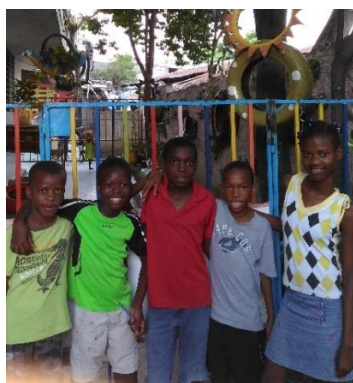
Visites aux enfants que nous parrainons à Nid d'Amour (Hinche) et Nid d'Espoir (Port au Prince).

Une prochaine mission est en préparation. L'occasion d'aller de Milot au nord aux Cayes au sud où nous avons eu des apparentements.