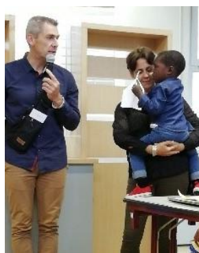
Témoignage émouvant d'une arrivée en France

Initiée il y a deux ans, la soirée témoignage du samedi a soulevé encore beaucoup d'émotion. Des parents revenus de la période de socialisation, d'autres réunis avec leur enfant, ont avec pudeur et sensibilité raconté leur vécu. Quelques larmes ont coulé même chez les plus endurcis.