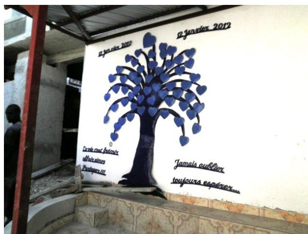
L'Arbre du souvenir chez Éveline