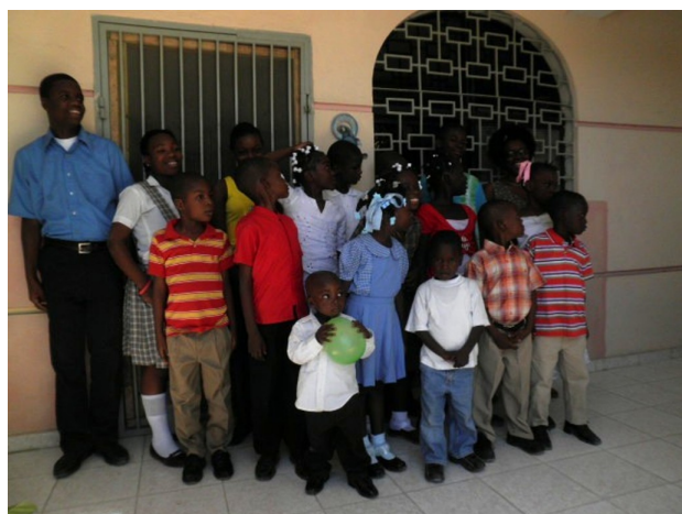
Un groupe de filleuls chez Édith, dans la banlieue de Port au Prince