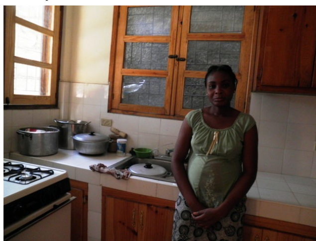
La cuisinière chez Elcy, dans un local réaménagé et tout neuf!