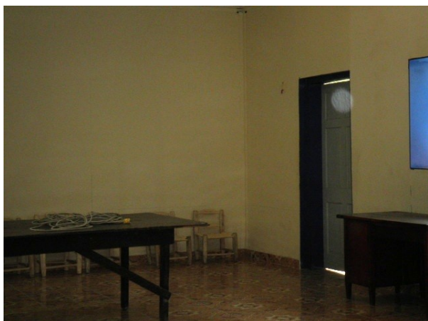
Une pièce destinée aux enfants chez Éveline