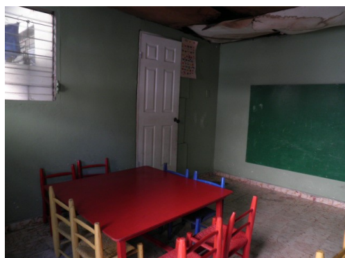
Une salle de classe chez Gina