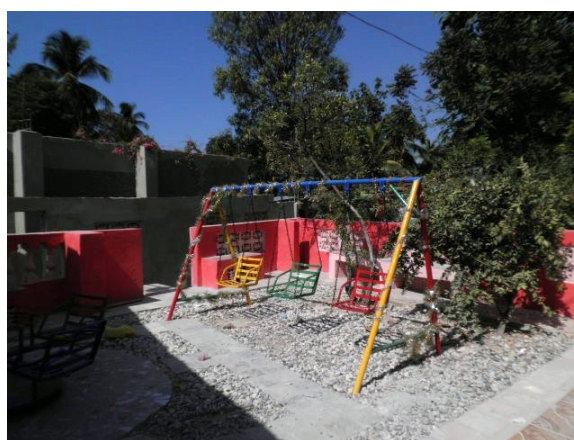
Coin jeux chez Éveline