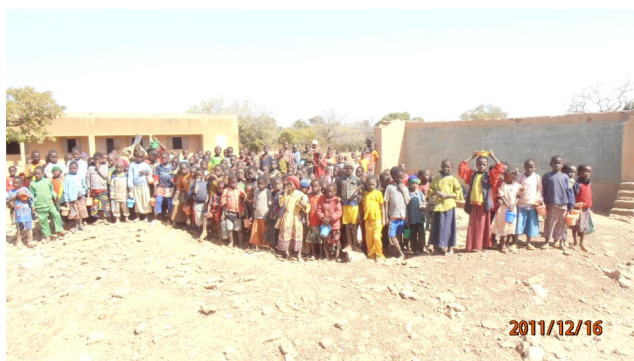
Les enfants attendent leur repas

Et puis il y a la cantine. Les enfants qui habitent pour la plupart loin de l'école y viennent à pied. Ils y restent la journée, déjeunent à l'école