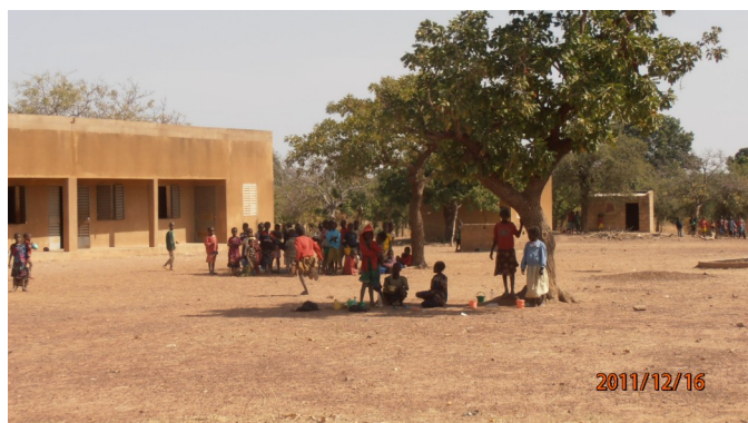
L'école écrasée de soleil