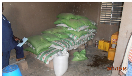
Stock de riz

Cependant, la sécheresse qui sévit a appauvri les familles qui ne sont pas en mesure, d'apporter leur écot pour le dernier trimestre. Pendant ce trimestre, sans repas de midi assuré, certains enfants ne viendront plus à l'école, d'autres seulement le matin et d'autres enfin, viendront la journée sans avoir de repas servi le midi.