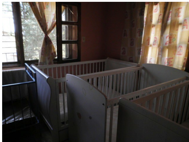
Chez Elcy, des petits lits offerts par l'entreprise Sauthon de Guéret.